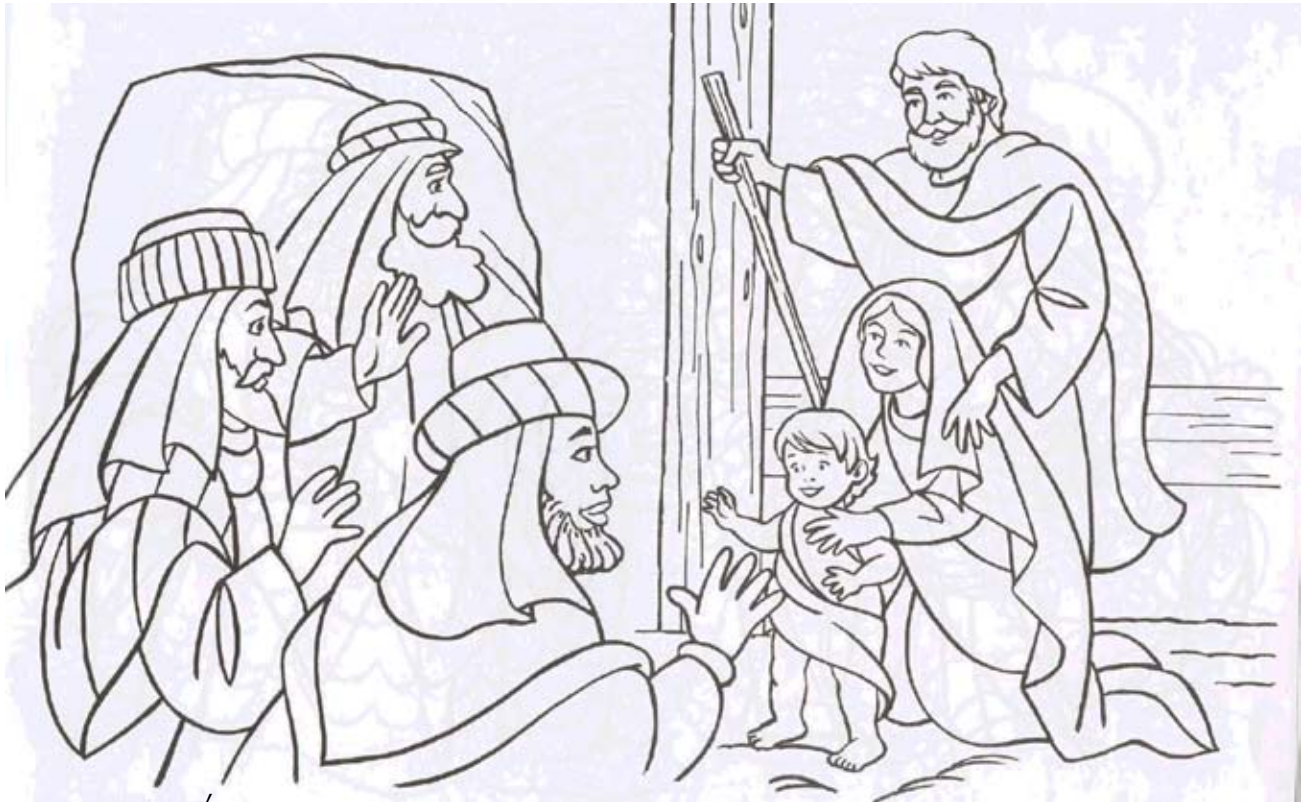
Ամբողջացուր ըստ Մարթէոսի Աւետարանին 2. 9-12

Քրահանգը, աստղը, առազնորդեց, երկրպագեցին, ոսկի, կնդրուկ, ՎՄՈՒՍ, երապի